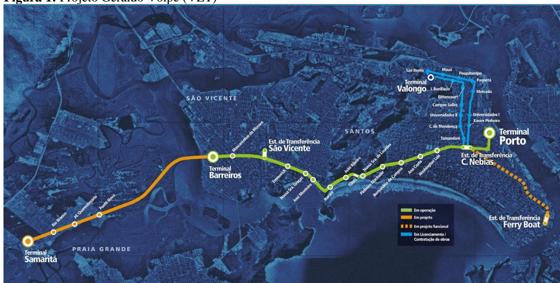
Figura 1: Projeto Geraldo Volpe (VLT)