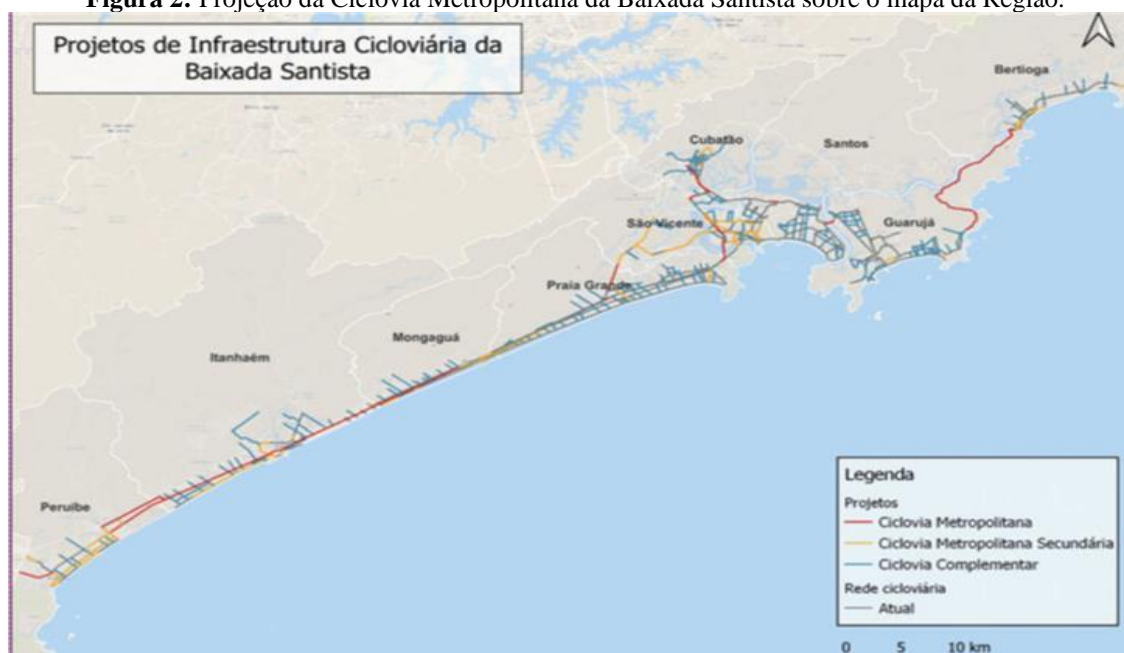
Figura 2: Projeção da Ciclovía Metropolitana da Baixada Santista sobre o mapa da Região.