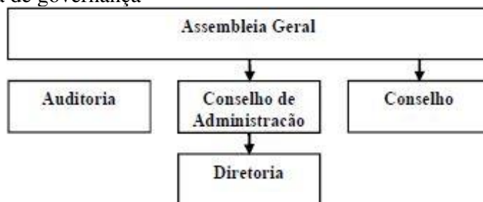
Figura 2 – Estrutura de governança

Neste contexto, Laimer e Tonial (2015) destacam que uma empresa familiar deve constituir uma estrutura de governança que seja adequada às suas atividades empresariais, instituindo órgãos necessários e observando os preceitos delineados pela Lei das Sociedades Anônimas. Os autores apresentam um modelo de governança corporativa para empresas familiares, conforme apresentado na Figura 2: